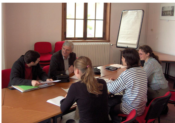
Réunion des pilotes associatifs

leur PDJ, le Conseil régional de Picardie et l'ADEME ont constitué un réseau de pilotes associatifs, spécialement formés sur les déplacements des jeunes, l'écomobilité et la mise en place d'un PDJ. Ces pilotes sont implantés dans les trois départements de la région.